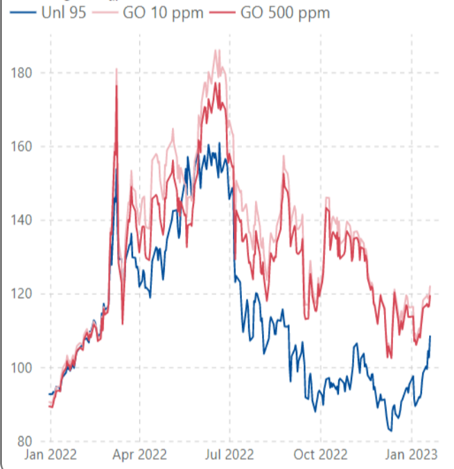
ราคากลางน้ำมันสำเร็จรูปตลาดภูมิภาคเอเชีย (เหรียญสหรัฐต่อบาร์เรล)