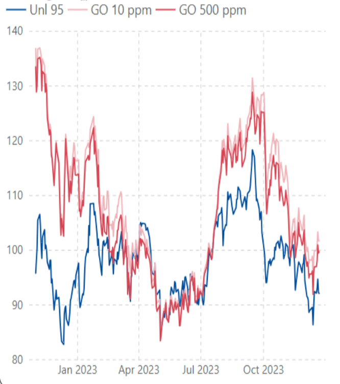
ราคากลางน้ำมันสำเร็จรูปตลาดภูมิภาคเอเชีย (เหรียญสหรัฐต่อบาร์เรล)