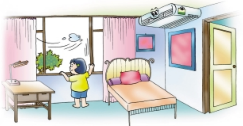
เปิดหน้าต่างและประตู เพื่อระบายอากาศก่อนเปิดเครื่องปรับอากาศ

ดังนั้น ถ้าเราป้องกันความร้อนทางหลังคาและผนังอย่างเหมาะสมก็จะสามารถลดการทำงานของเครื่องปรับอากาศที่ใช้งานได้ และไม่เปลืองค่าไฟฟ้าอีกด้วย