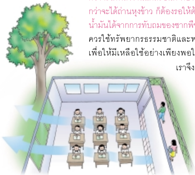
ทำช่องลมในทิศตรงกันข้าม เพื่อเปิดช่องทางให้ลมไหลเวียนเข้าในห้อง

เราจึง ควรรู้จักใช้อุปกรณ์ต่างๆ ที่ใช้พลังงานอย่างมีประสิทธิภาพ