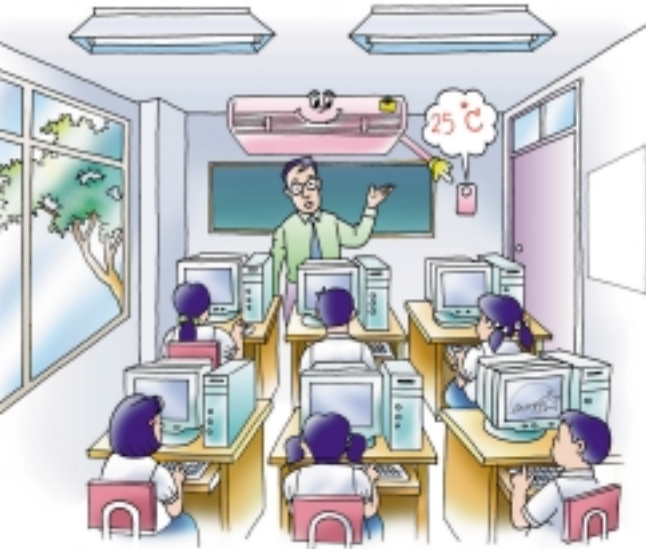
ตั้งอุณหภูมิของเครื่องปรับอากาศให้เหมาะสม คือไม่ต่ำกว่า 25 °C

6. ขอความร่วมมือจากนักเรียนทุกคน ช่วยกันปิดไฟหลังเลิกเรียนหรือเมื่อไม่ใช้ห้องเรียนแล้ว เพราะถึงแม้จะเป็นหลอดไฟประหยัดพลังงาน แต่ถ้าลืมปิด หรือเปิดทิ้งไว้ ก็จะไม่ช่วยให้ประหยัดพลังงานแต่อย่างใด