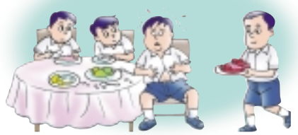
ควรตักอาหารแต่พอดี

ตัวอย่างข้างต้นนี้ชี้ชัดให้เรามองเห็นพลังงานที่เกี่ยวข้องในชีวิตประจำวันของเรา ยังมีการใช้พลังงานในลักษณะอื่นๆ อีกมากมายในชีวิตประจำวันที่เราควรจะร่วมกัน ใช้อย่างประหยัด และใช้อย่างมีประสิทธิภาพ