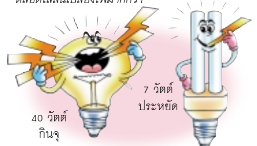
40 วัตต์ กินจุ