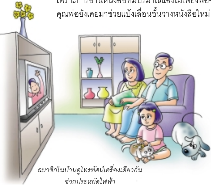
สมาชิกในบ้านดูโทรทัศน์เครื่องเดียวกัน ช่วยประหยัดไฟฟ้า

คุณพ่อยังคงมาช่วยแบ่งเดือนชั้นวางหนังสือใหม่ เพื่อไม่ให้บังแสงบางส่วนจากทางหน้าต่าง