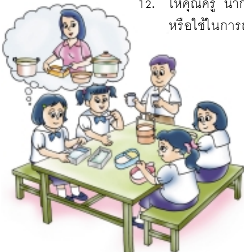
การใช้กล่องข้าวแทนกล่องโฟม

12. ให้คุณครู นำกระดาษที่ใช้แล้วด้านเดียวมาใช้ประโยชน์ต่อ หรือใช้ในการถ่ายเอกสาร