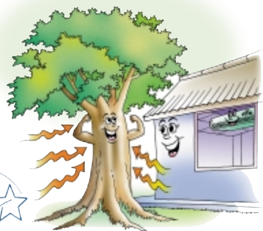
ต้นไม้ขนาดใหญ่ ช่วยดูดซับความร้อนจากบริเวณรอบต้นไม้

12. ให้คุณครู นำกระดาษที่ใช้แล้วด้านเดียวมาใช้ประโยชน์ต่อ หรือใช้ในการถ่ายเอกสาร