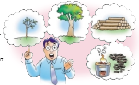
กว่าจะได้ถ่านหุงข้าวต้องรอให้ต้นไม้เติบโต

กว่าจะได้พลังงานแต่ละชนิด ต้องใช้ระยะเวลา กว่าจะได้ถ่านหุงข้าว ก็ต้องรอให้ต้นไม้เติบโต น้ำมันได้จากการทับถมของซากพืชและซากสัตว์นับพันล้านปี ควรใช้ทรัพยากรธรรมชาติและพลังงานทุกชนิดอย่างคุ้มค่า เพื่อให้มีเหลือใช้อย่างเพียงพอในรุ่นเราถึงรุ่นลูกหลาน