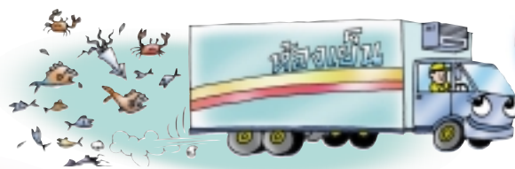
รถขนส่งอาหารก็ต้องใช้น้ำมัน