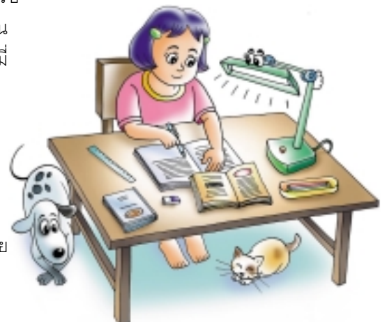
ทำการบ้าน และทบทวนวิชาที่เรียนมา

เมื่อกลับบ้าน แบ่งอาบน้ำ และร่วมรับประทานอาหารค่ำอันแสนอร่อยฝีมือของคุณแม่แล้ว แบ่งจึงนำวิชาที่เรียนในวันนี้มาทบทวนและทำการบ้านจนเสร็จ