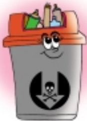
รับขยะอันตรายครับ