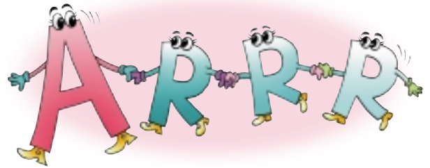
Avoid หลีกเลี่ยง

สำหรับทิ้งขยะทั่วไปที่ย่อยสลายไม่ได้ หรือไม่เป็นพิษแต่นำไปแปรรูปยากหรือไม่คุ้มค่าในการแปรรูป เช่น พลาสติกที่ห่อลูกอม ของบะหมี่สำเร็จรูป ถุงพลาสติกหรือโฟมที่เปื้อนอาหาร