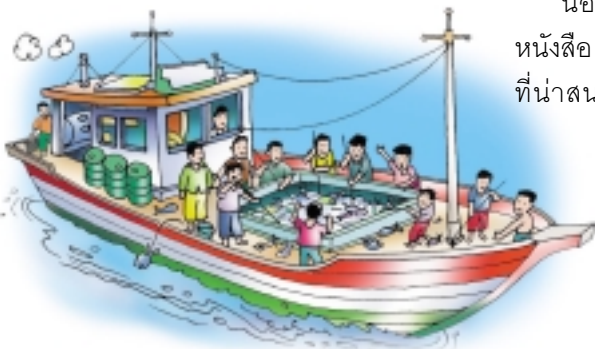
เรือประมงต้องใช้น้ำมัน น้ำแข็งก็ต้องใช้พลังงานในการผลิต

“...ปลาน้ำนํ้าหายาก ต้องล่าปากออกเรือไป ขนส่งจากแดนไกล ใช้น้ำแข็งเปลืองน้ำมัน แช่เย็นก็เสียไฟ หุงต้มไคร้ก็ซาทังนั้น พลังงานต้องหมกกัน ใ้อู่กลุหลานจำจงดี”