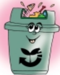
รับขยะเปียกครับ