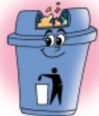
รับขยะทั่วไปครับ