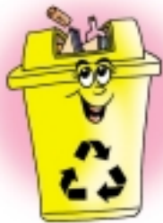
รับขยะแห้งคะ