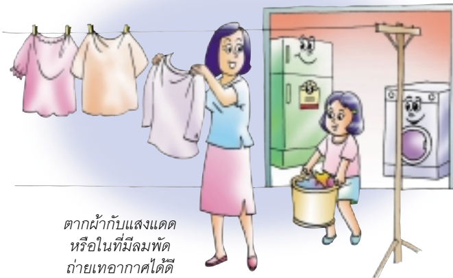
ตากผ้ากับแสงแดดหรือในที่ที่มีลมพัดถ่ายเทอากาศได้ดี

คุณแม่บอกว่าเวลาซักผ้าต้องนำผ้ามาแยกตามประเภท และแช่ผ้าก่อนเข้าเครื่องจะทำให้สิ่งสกปรกออกจากเนื้อผ้าได้ง่ายขึ้นไม่ต้องมีการซักซ้ำ จึงช่วยประหยัดไฟ