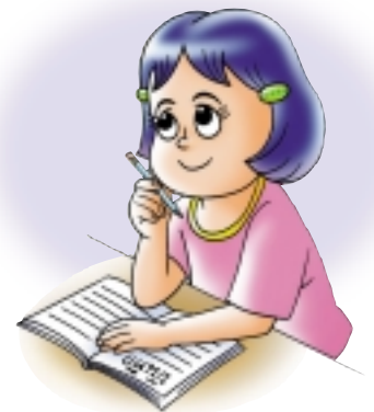
เยาวชนที่ดีช่วยกันประหยัดพลังงาน

และสิ่งที่แม่ตั้งใจจะเกิดขึ้นได้ต่อเมื่อเรา คนไทยทุกคนร่วมมือร่วมใจกันประหยัดพลังงาน โดยเฉพาะเยาวชนมีบทบาทสำคัญที่จะต้องกระตุ้น และเตือนสติซึ่งกันและกันให้เห็นถึงปัญหาดังกล่าว และลงมือปฏิบัติอย่างจริงจัง