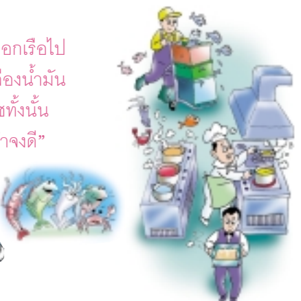
การปรุงอาหารก็ต้องใช้ก๊าซหุงต้ม