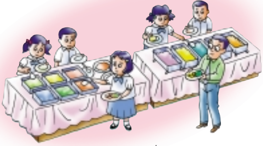
ไม่ตักอาหารเผื่อ ไม่ตักอาหารเกิน

นื่องแบ้งเข้าใจสำนวนดีว่า กว่าทุกคนจะได้ทานปลาหรืออาหารทะเลต่างๆ นั้น เรือประมงต้องเติมน้ำมันออกไปหาปลาหรืออาหารเหล่านั้นถึงกลางทะเล เมื่อจับปลาได้แล้ว ต้องใช้ น้ำแข็งแช่ปลาที่จับได้ น้ำแข็งนี้ก็ได้อาจจากการใช้พลังงานผลิตน้ำให้เป็นน้ำแข็ง เมื่อเรือประมงเทียบท่าริมทะเล ก็ต้องมีรถเพื่อ ลำเลียงขนส่ง ปลาและอาหารทะเลเหล่านี้กระจายไปตามท้องตลาดหรือจังหวัดต่างๆ ซึ่ง ล้วนต้องใช้พลังงานน้ำมันทั้งสิ้น