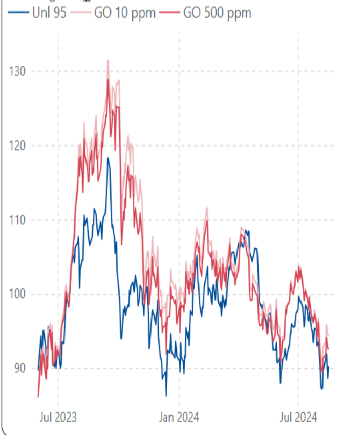
ราคากลางน้ำมันสำเร็จรูปตลาดภูมิภาคเอเชีย (เหรียญสหรัฐต่อบาร์เรล)