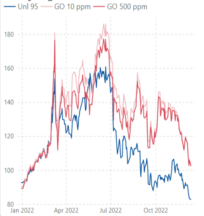
ราคากลางน้ำมันสำเร็จรูปตลาดภูมิภาคเอเชีย (เหรียญสหรัฐต่อบาร์เรล)