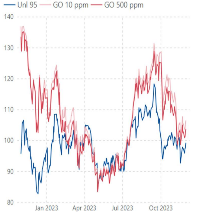
ราคากลางน้ำมันสำเร็จรูปตลาดภูมิภาคเอเชีย (เหรียญสหรัฐต่อบาร์เรล)