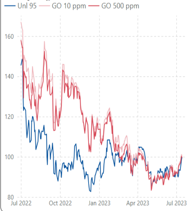
ราคากลางน้ำมันสำเร็จรูปตลาดภูมิภาคเอเชีย (เหรียญสหรัฐต่อบาร์เรล)