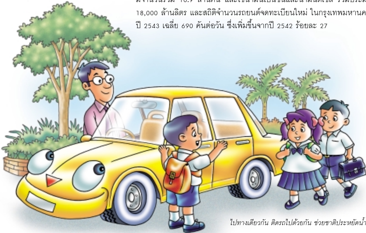
ไปทางเดียวกัน ดิครถไปด้วยกัน ช่วยชาติประหยัดน้ำมัน