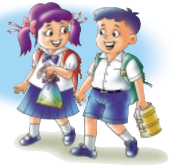
ใช้ถุงผ้าเมื่อไปซื้อของหรือจ่ายตลาด