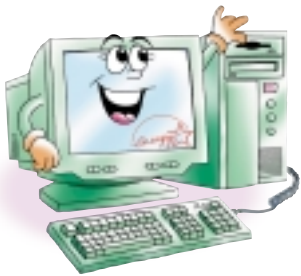
คอมพิวเตอร์ Energy Star