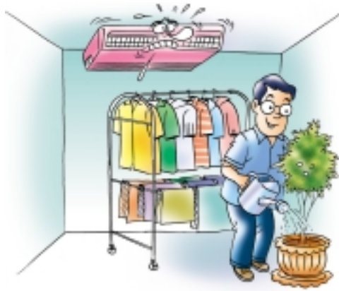
ไม่ปลูกต้นไม้ ไม่ตากผ้าในห้องที่มีการปรับอากาศ จะทำให้เครื่องปรับอากาศทำงานหนักขึ้น