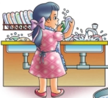
อย่าเปิดก๊อกน้ำไหลทิ้งขณะล้างจาน สิ้นเปลืองน้ำ