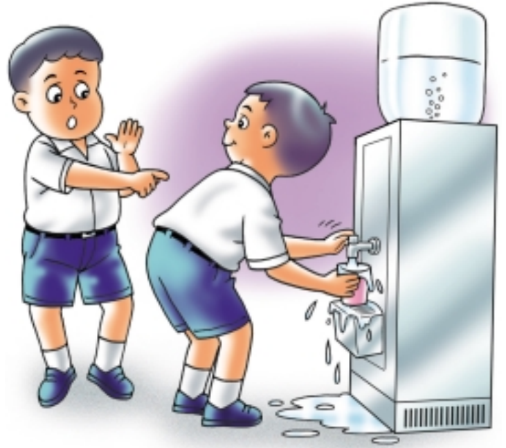
กดน้ำแต่พอดีม อย่ากดจนล้นแก้ว