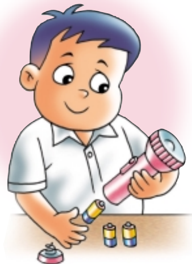
ควรใช้ถ่านไฟฉายชนิดที่สามารถบรรจุไฟได้ใหม่

นักเรียนอย่าลืมแนะนำคุณแม่ หันมาใช้ถ่านไฟฉายที่สามารถบรรจุไฟได้ใหม่ ถึงแม้ว่าถ่านไฟฉายชนิดนี้จะมีราคาแพงกว่าชนิดธรรมดา แต่ถ้าเทียบกับการซื้อถ่านไฟฉายชนิดธรรมดาหลายๆ ครั้ง ผลโดยรวมในระยะยาวของการใช้ชนิดบรรจุไฟได้ใหม่จะมีราคาถูกกว่า และยังช่วยลดจำนวนขยะอันตรายลงอีกด้วย