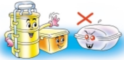
ใช้ปิ่นโตหรือใช้กล่องใส่อาหาร แทนการใช้กล่องโถม