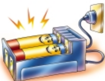
ممคือ Rechargeable Battery