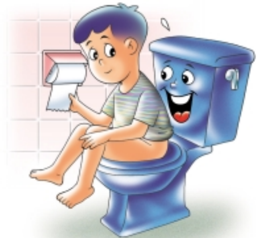
ควรดึงกระดาษชำระเท่าที่จำเป็นต้องใช้