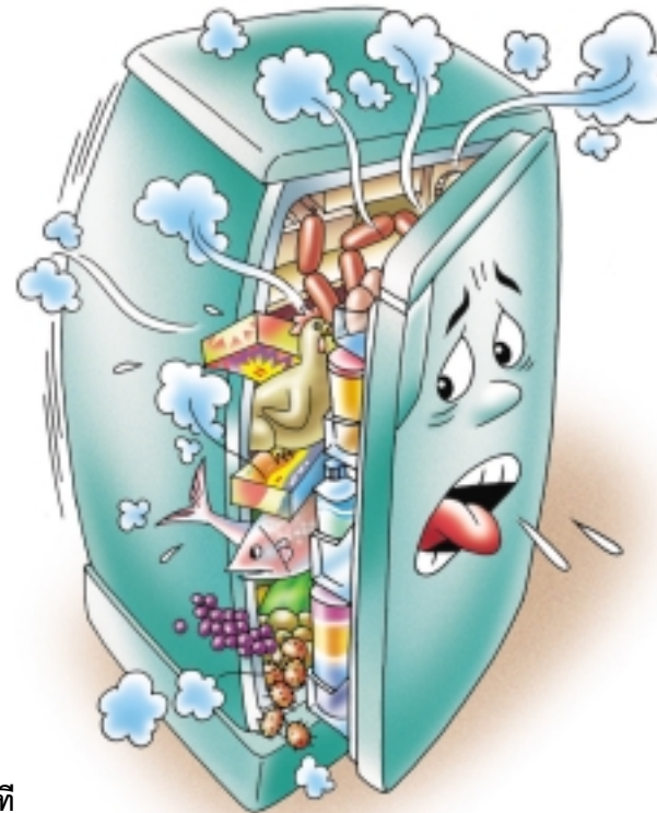
อย่าแช่อาหารจนแน่นตู้เย็น