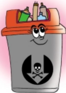
ถังใส่ขยะอันตราย