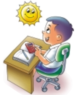
ใช้เครื่องคิดเลขพลังงานแสงอาทิตย์