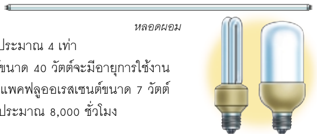
หลอดคอมแพคฟลูออเรสเซนต์

พลังงานที่หลอดไส้ใช้ กลายเป็นความร้อน 9 ส่วน แต่ได้แสงสว่างเพียง 1 ส่วน