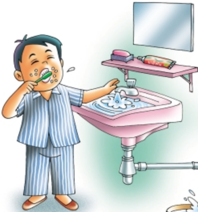
อย่าเปิดก๊อกน้ำทิ้งไว้ในขณะแปรงฟัน จะสิ้นเปลืองน้ำ