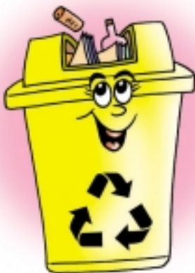
ถังขยะแห้ง