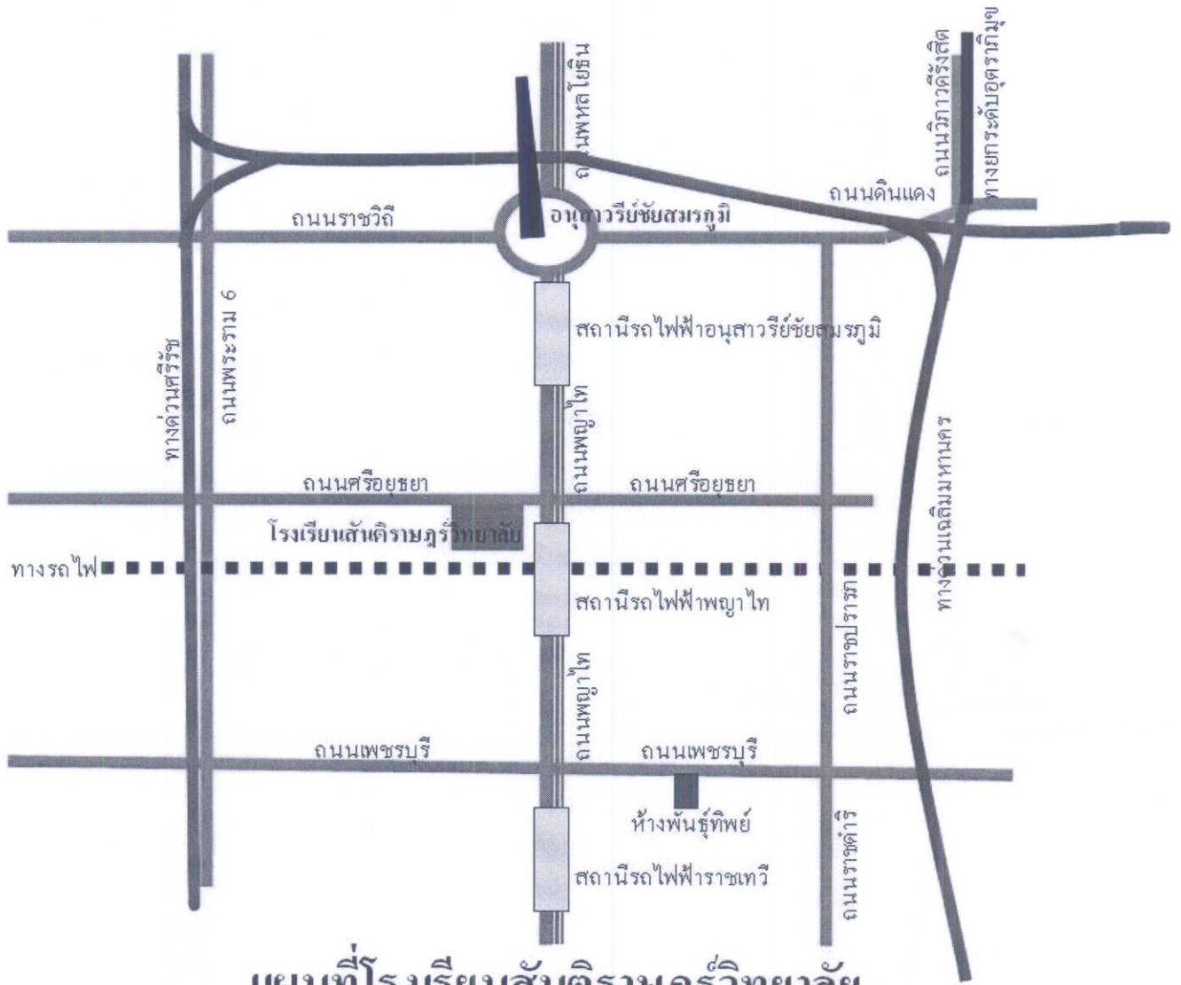
แผนที่โรงเรียนสันติราษฎร์วิทยาลัย