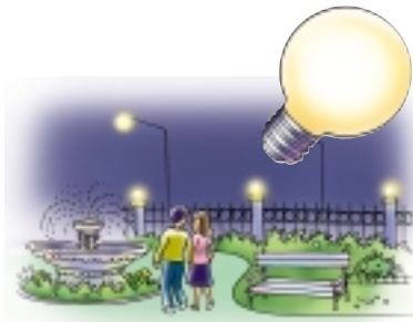
ใช้หลอดแสงจันทร์

หลอดแสงจันทร์ ประสิทธิภาพแสงต่ำกว่าหลอดฟลูออเรสเซนต์เล็กน้อยแต่อายุการใช้งานนานกว่า จึงเหมาะสมกับการใช้เป็นไฟถนน ไฟสนามตามสวนสาธารณะ แต่เมื่อใช้ไปนาน ๆ คุณภาพแสงจะลดลง