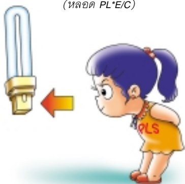
หลอดตะเกียบขั้วเสียบ (หลอด PLS)

3. หลอดตะเกียบตัวยู 3 ขด (หลอด PL*E/T) ขนาดกะทัดรัด 20 และ 23 วัตต์ ขจัดปัญหาหลอดยาวเกินโคม ให้แสงสว่างมากและสามารถ ใช้เปลี่ยนแทนหลอดไส้ได้ ประหยัดไฟได้ร้อยละ 80 ของหลอดไส้