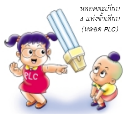
หลอดตะเกียบ 4 แท่งขั้วเสียบ (หลอด PLC)

4. หลอดตะเกียบขั้วเสียบ (หลอด PLS) บัลลาสต์ภายนอกขนาด 7, 9 และ 11 วัตต์ ประหยัดไฟร้อยละ 80 ของหลอดไส้