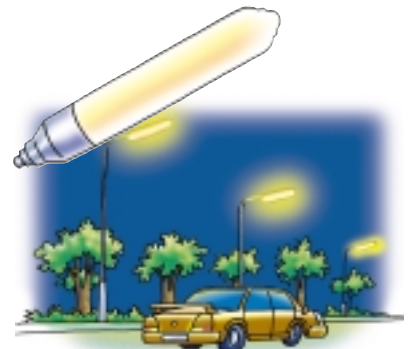
ใช้หลอดโซเดียมความดันต่ำ

หลอดโซเดียมความดันสูง ประสิทธิภาพสูง แต่คุณภาพแสงไม่ดี มักใช้กับไฟถนน คลังสินค้า ไฟส่องบริเวณที่เปลี่ยนหลอดยาก พื้นที่นอกอาคาร