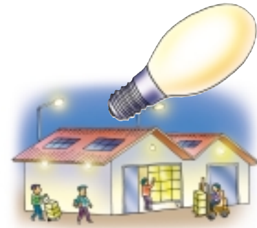
ใช้หลอดโซเดียมความดันสูง

หลอดแสงจันทร์ ประสิทธิภาพแสงต่ำกว่าหลอดฟลูออเรสเซนต์เล็กน้อยแต่อายุการใช้งานนานกว่า จึงเหมาะสมกับการใช้เป็นไฟถนน ไฟสนามตามสวนสาธารณะ แต่เมื่อใช้ไปนาน ๆ คุณภาพแสงจะลดลง