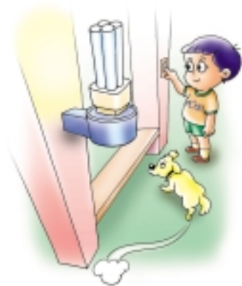
หลอดตะเกียบ 4 แท่งขั้วเกลียว (หลอด PL*E/C)

2. หลอดตะเกียบ 4 แท่ง ขั้วเกลียว (หลอด PL*E/C) ขนาด 9, 11, 15 และ 20 วัตต์ มีบัลลาสต์อิเล็กทรอนิกส์ในตัว เปิดติดทันที ไม่กระพริบ ประหยัดไฟได้ร้อยละ 80 เมื่อเทียบกับหลอดไส้ และยังสามารถใช้ได้ในพื้นที่อุณหภูมิต่ำถึง -20 °C