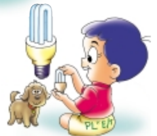
หลอดตะเกียบตัวยู 3 ขด (หลอด PL*E/T)

2. หลอดตะเกียบ 4 แท่ง ขั้วเกลียว (หลอด PL*E/C) ขนาด 9, 11, 15 และ 20 วัตต์ มีบัลลาสต์อิเล็กทรอนิกส์ในตัว เปิดติดทันที ไม่กระพริบ ประหยัดไฟได้ร้อยละ 80 เมื่อเทียบกับหลอดไส้ และยังสามารถใช้ได้ในพื้นที่อุณหภูมิต่ำถึง -20 °C