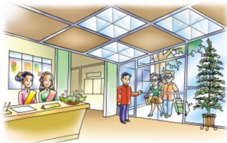
ใช้แสงธรรมชาติจากหลังคา