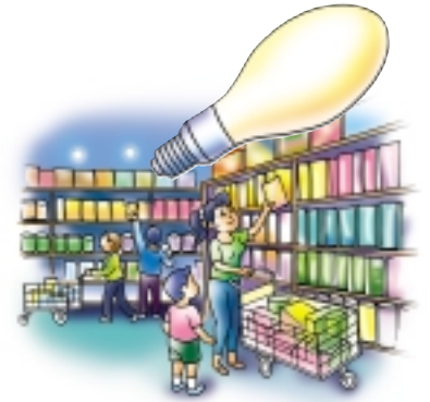
ใช้หลอดเมทัลฮาไลด์

หลอดเมทัลฮาไลด์ ประสิทธิภาพสูง คุณภาพแสงดี แต่ต้องใช้เวลาอุ่นหลอดเมื่อเปิด เหมาะสำหรับการใช้ส่องสินค้าในห้างสรรพสินค้า