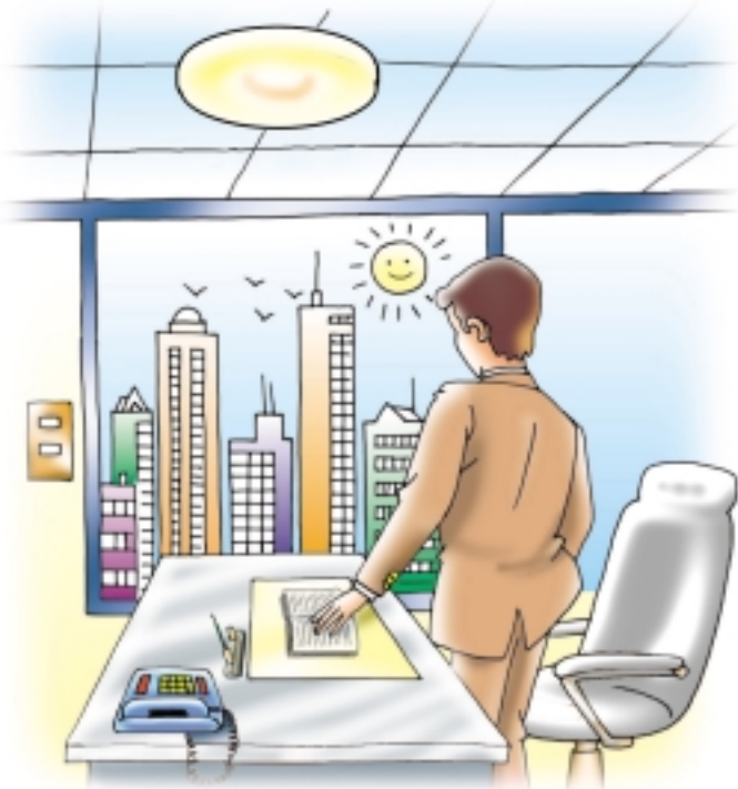
ใช้แสงธรรมชาติเข้าช่วย