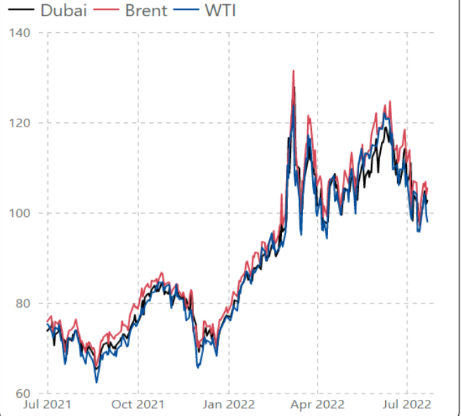
ราคาน้ำมันดิบตลาดโลก (เหรียญสหรัฐต่อบาร์เรล)