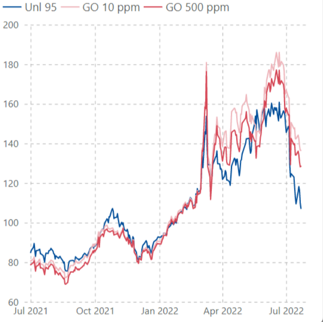
ราคากลางน้ำมันสำเร็จรูปตลาดภูมิภาคเอเชีย (เหรียญสหรัฐต่อบาร์เรล)