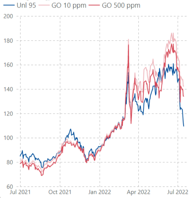
ราคากลางน้ำมันสำเร็จรูปตลาดภูมิภาคเอเชีย (เหรียญสหรัฐต่อบาร์เรล)