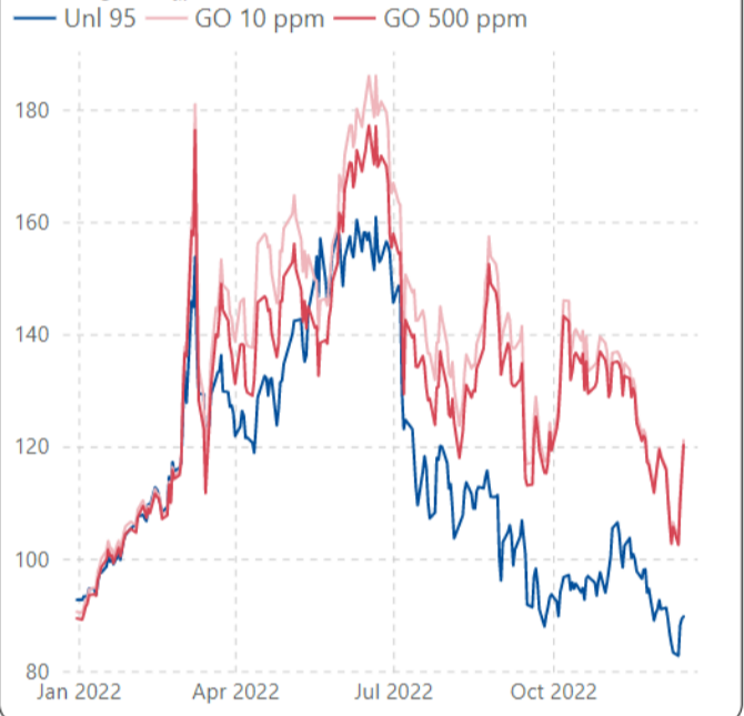
ราคากลางน้ำมันสำเร็จรูปตลาดภูมิภาคเอเชีย (เหรียญสหรัฐต่อบาร์เรล)