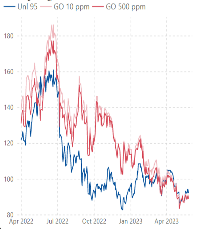
ราคากลางน้ำมันสำเร็จรูปตลาดภูมิภาคเอเชีย (เหรียญสหรัฐต่อบาร์เรล)